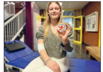
Junge Erstspenderin, die nach ihrer Blutspende die Information über ihre Blutgruppe erhält

Da die Präparate, die aus dem Spenderblut hergestellt werden, nur eine kurze Haltbarkeit von teilweise wenigen Tagen haben, sind Patienten gerade auch in der Sommer- und Ferienzeit auf das Engagement zahlreicher Spenderinnen und Spender angewiesen.