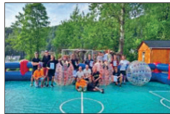
So sehen Sieger aus

Am Samstagnachmittag startete das Bubble Soccer Turnier mit 9 Mannschaften. Dieses Jahr ging es schon ein bisschen gewagter zu als im vergangenen Jahr! Somit hatte die einzige Mädelsmannschaft keine Chance gegen die bö... Buben!!! Aber ihr habt euch tapfer geschlagen, Mädels. Der Kuchenbasar der Landfrauen lockte wie immer viele Gäste aus Nah & Fern an, sodass das Festzelt zum Auftritt der Blaskapelle FFW Colmnitz gut gefüllt war und eine gute Stimmung aufkam. Übrigens, der Erlös des Kuchenbasars vom Vorjahr, von 2024 sowie die Geldsammlung zum Maibaumsetzen wurden zum Erwerb der neuen Rutsche auf dem Spielplatz in „Holzhau's Mitte an der Knobelhütte“ genutzt. Vielen Dank an die zahlreichen Backfeen und Spender.